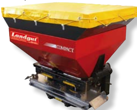
ZS Compact fruit, 600 l Trichteraufsatz 200 l Abdeckplane